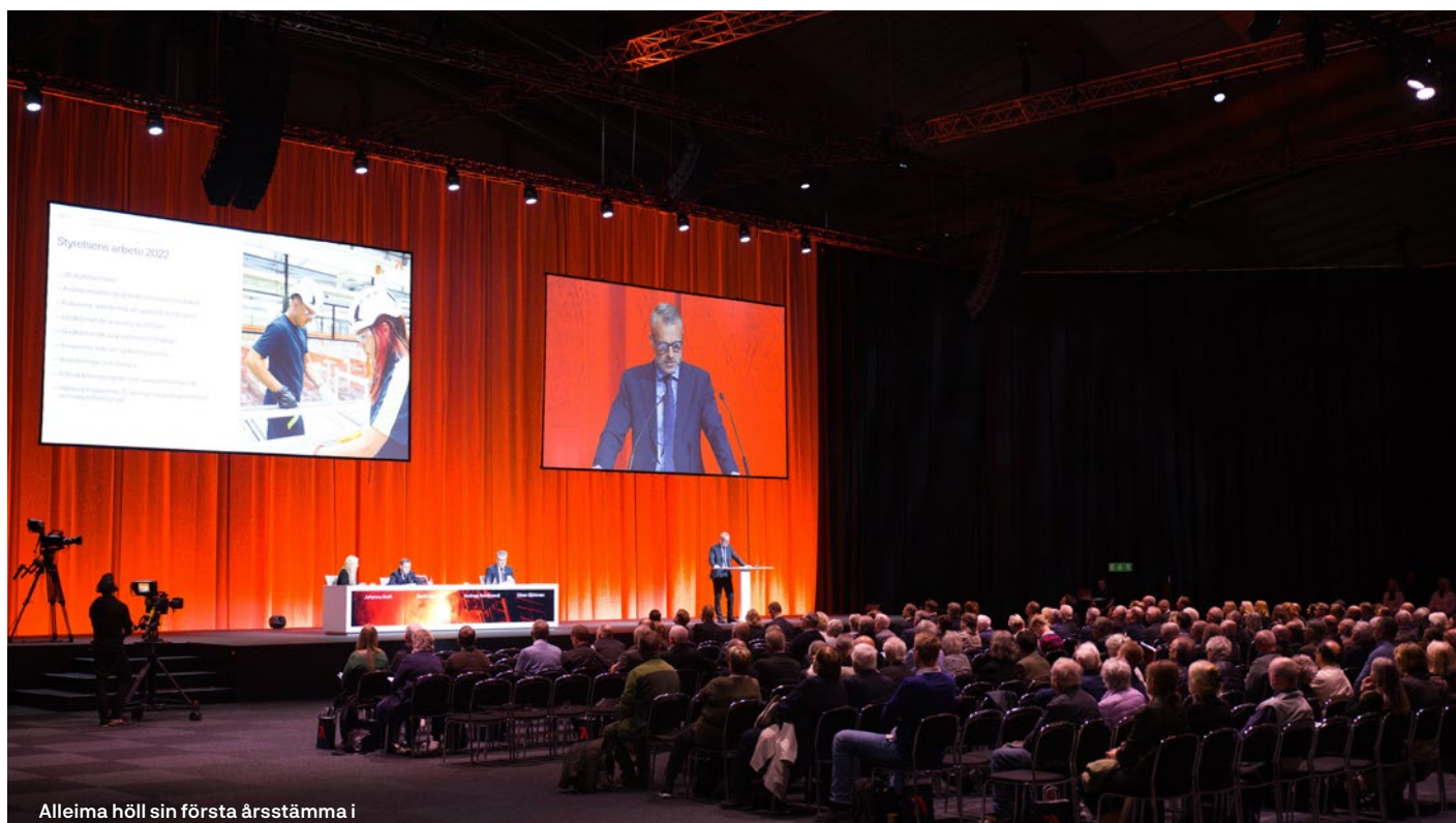
Alleima höll sin första årsstämma i